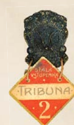
Sletový odznak se stálou vstupenkou od K. Nováka, 1907