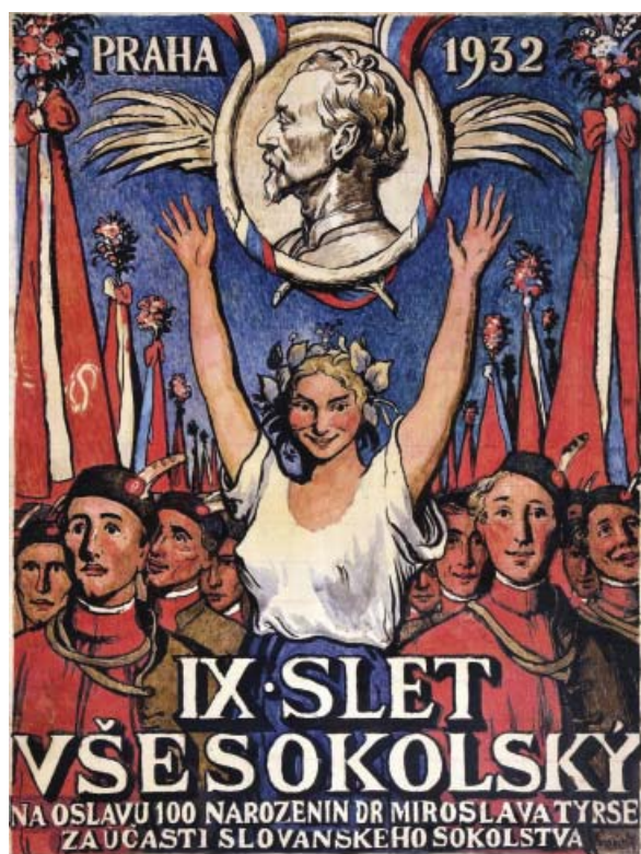
Max Švabinský a jeho hlavní sletový plakát pro IX. všesokolský slet 1932