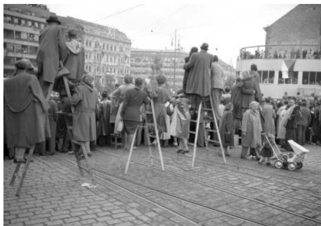
Slet 1948 – Diváci sletového průvodu u Václavského náměstí