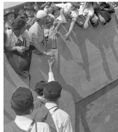
Slet 1938 – Diváci na Strahovském stadionu