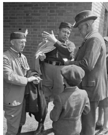
Slet 1938 – Pořadatelé a návštěvníci

Koblic fotografoval od roku 1909, nejprve s vlastnoručně sestrojeným fotoaparát, kde místo objektivu použil sklo z babiččinych brýlí, později s přístrojem na skleněné desky, který dostal k Vánocům 1910. Potřeba malého laciného fotoaparátu, který by umožňoval