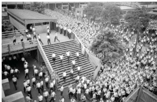
Slet 1948 – Úprk na toalety

Slet 1938 – I nejmladší fotografovali... I. P. Pavlova)