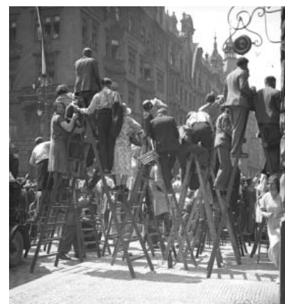
Slet 1932 – Diváci sletového průvodu (Staré Město, křižovatka ulic Pařížská a Široká)

Menší část dochovaných snímků se sportovní tematikou je spojena s vinohradským Sokolem. Patrně někdy v letech 1914–1918 pořídil Koblíc na letním cvičišti této tělocvičné jednoty, které se tehdy nacházelo za vinohradskou vodárnou, sérii záběrů z nácivku vystoupení dorostenců (tzv. bílé skupiny). Ze stejné doby se dochovalo také několik zajímavých záběrů ze společenských aktivit vinohradského Sokola (sokolská hudba, loutkové divadlo apod.). Unikátní jsou rovněž snímky tělocvičny v Národním domě na Vinohradech, kterou měl vinohradský Sokol pronajatou od roku 1895. Za první světové války, v letech 1916–1918, sloužila jako skladiště mouky, jak dokládají i Koblícovy fotografie z roku 1917. V červnu 1918 bylo v časopise Světozor otištěno několik Koblícových snímků z vystoupení této tělocvičné jednoty na hřišti nedaleko vinohradské