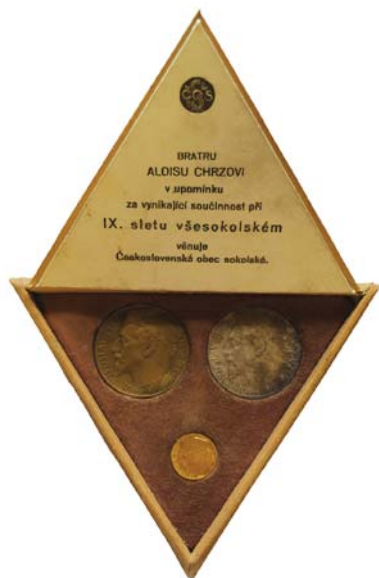
Kolekce medailí pro zasloužilé funkcionáře sletu a sokolské činovníky od J. Brůhy, IX. všesokolský slet 1932

diplomů pro vítěze ve sletových závodech. Zahraniční hosté si zase odváželi pamětní list navržený Maxem Švabinským.