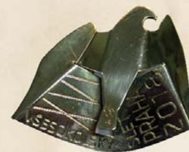
Jakub Lipavský, 2018