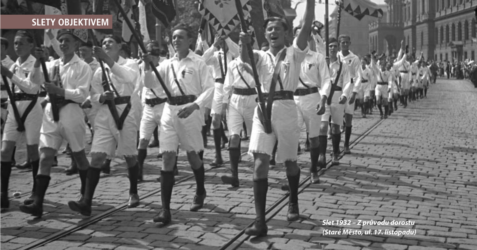
Slet 1932 – Z průvodu dorostu (Staré Město, ul. 17. listopadu)