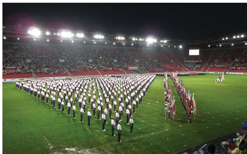
Slavnostní ceremoniál při XV. všesokolském sletu v roce 2012

pomníku na Olšanských hřbitovech. Tato vzpomínka se stala neopomenutelným bodem všesokolských sletů. Slavnostní zahájení sletu se vrátilo zpět na jeviště Národního divadla. Představení „Prodaná nevěsta“ pro tuto příležitost nastudovaly sokolské divadelní, folklorní a pěvecké soubory pod režisérskou taktovkou bratra Bohumila Gondíka. Asi 200 sokolů včetně zahraničních hostů se zúčastnilo setkání v Poslanecké sněmovně. Po úspěšné premiéře při minulém sletu se znovu uskutečnil Sokol Gala. Celý slet a s ním i oslavy 150 let existence Sokola vyvrcholily na stadionu v pražských Vršovicích. Počasí sokolům příliš nepřálo a na hlavy cvičenců se snášel hustý déšť. V dlouhé historii všesokolských sletů se tak nestalo poprvé. Déštěm se nenechali zaskočit ani cvičenci jednotlivých hromadných skladeb, ani 416 cvičenců folklorní skladby „Radostná země“. Od té chvíle uplynulo již šest let. Sokolové se znovu setkají nejen na značkách již brzy, v červenci 2018 při XVI. všesokolském sletu.