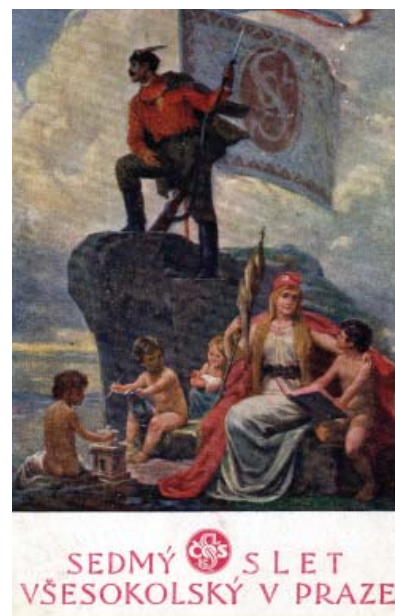
Pohlednice k VII. všesokolskému sletu 1920 vydaná ČOS podle originálu od Františka Ženiška