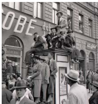
Slet 1938 – Diváci sletového průvodu (Nové Město, náměstí

Slet 1938 – I nejmladší fotografovali... I. P. Pavlova)