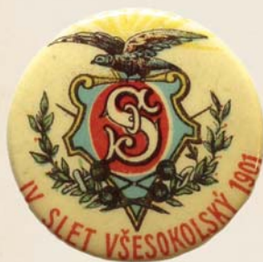
Pamětní odznak, autor neznámý, 1901