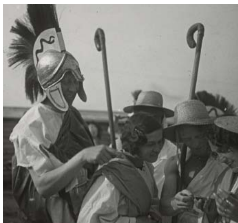
Slet 1932 – Účinkující sletové scény Tyršův sen

Naprostá většina Koblícových fotografií se sportovní tematikou se pak týká všesokolských sletů, které se konaly v letech 1932, 1938 a 1948. Koblíc spíše než hromadná vystoupení zajímalo dění v zákulisí, zejména sokolové čekající a připravující se na seřadišti na své vystoupení či při odpočinku, stejně jako návštěvníci stadionu či diváci při sletových průvodech v ulicích Prahy. Pohledy na sletišťe ze speciálně upravených věží vyhrazených pro fotografy považoval za stereotypní a nezajímavé. Fotografování, a to nejen o sletu, chápal především jako lov zajímavých motivů, kdy fotograf nemá nečinně čekat na zajímavý záběr, ale aktivně jej vyhledávat a přemýšlet,