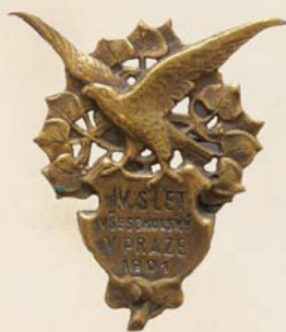
Sletový odznak od K. Němečka, 1901