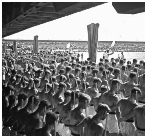
Slet 1932 – Nástup dorostenců