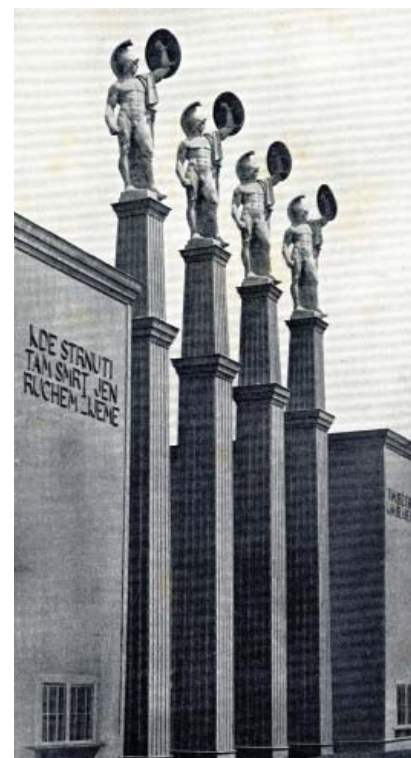
Jižní brána sletišť VI. VS 1912, architektonická výzdoba zcela korespondovala se sletovou scénou „Marathon“

IV. všesokolský slet v roce 1901 přinesl řadu novinek. Tou nejvýznamnější bylo jistě první veřejné vystoupení žen na sletu, dále pak také první oficiální sletový plakát. Poprvé byla do výzdoby sletišť začleněna i sochařská díla. Sochy na sletišti, potažmo celková umělecká podoba často korespondovaly s celým motivem sletu, tak tomu bylo například v roce 1912 při VI. všesokolském sletu, kdy sochařská výzdoba zapadala zcela do kontextu sletové scény „Marathon“. Nebývalý zájem u umělců vzbudil VII. všesokolský slet v roce 1920, první slet v nově vzniklé Československé republice. Všichni, kteří v umělecké sféře měli jméno, se chtěli na této významné události podílet. Velmi dobře si uvědomovali, že slet bude oslavou nově nabyté