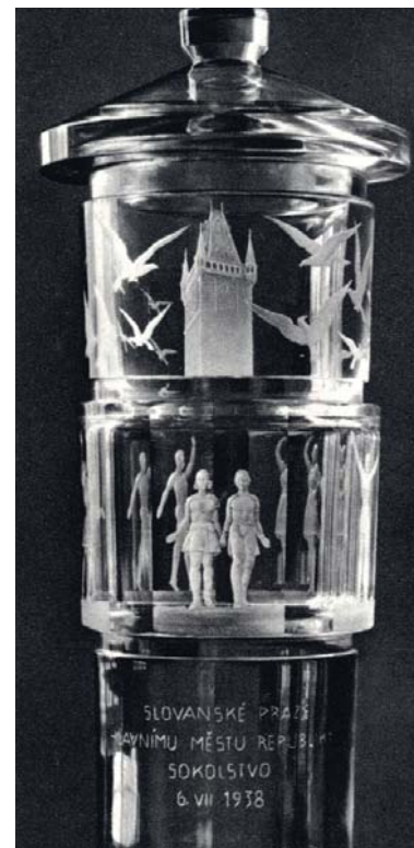
Broušená křišťálová váza jako dar sokolstva Praze, autorem vázy J. Drahoňovský