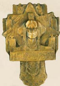
Sletový odznak od S. Suchardy, 1912