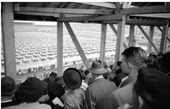
Slet 1948 – Pohled z tribuny na prostná mužů